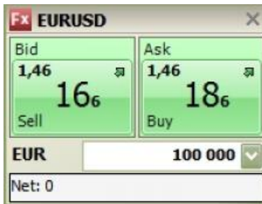
Egy instrumentum Trade board nézetben

A listázó nézet (Price list) helyett választhatja a kevesebb instrumentumot megjelenítő, de könnyebben átlátható elrendezést is (Trade board), amelyben a bid/ask árak nagyobb méretben kerülnek megjelenítésre és szintén egy kattintással rögzíthető megbízás a rendszerben.